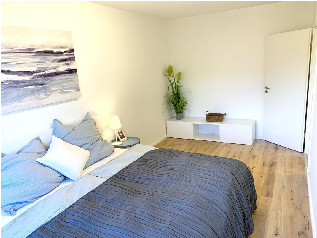
Schlafzimmer Ansicht 2